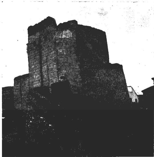
Castillo de Valencia de Alcántara.