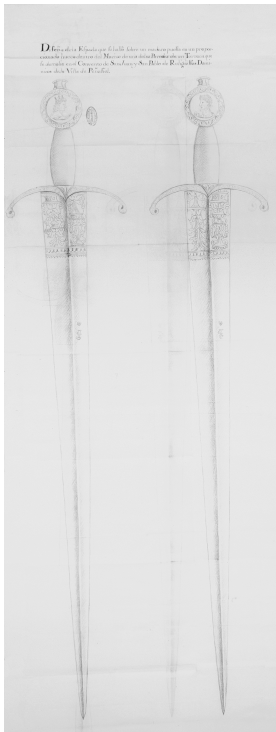
Fig. 1.- Dibujo de la espada hallada en el convento de San Juan y San Pablo de Peñafiel (Valladolid). Madrid, 1752. Real Academia de la Historia. Madrid. Ms. 9-5930.