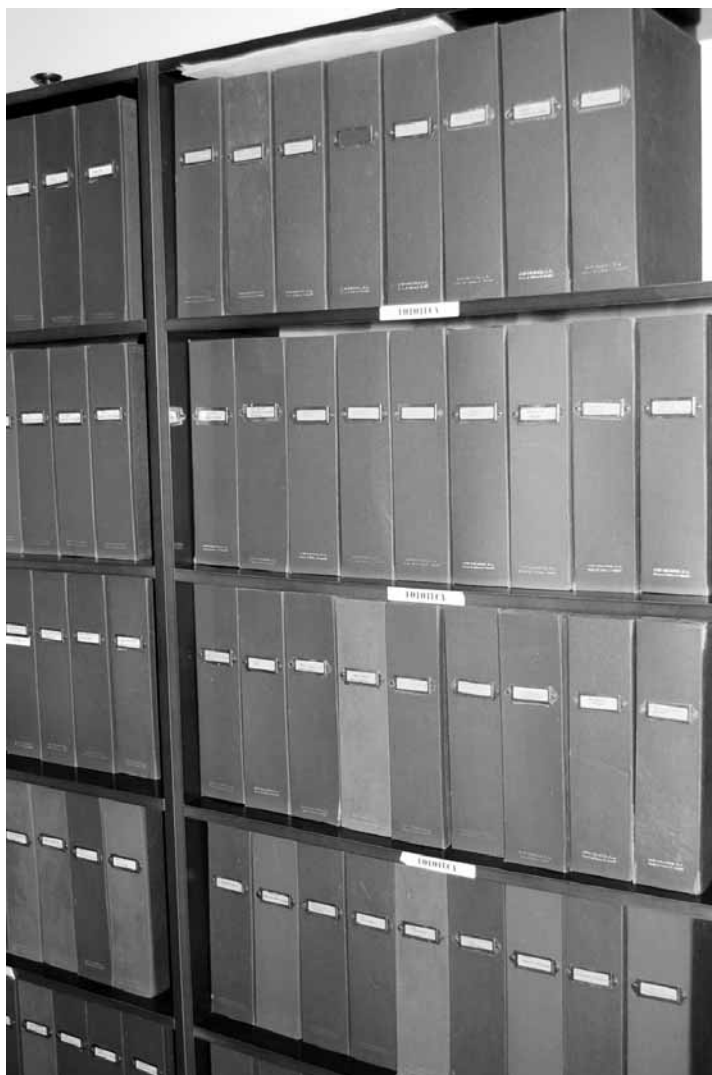
Fig. 16. Detalle del archivo de imágenes de la fototeca del antiguo IEAA. Fototeca del IHH. Colección documental.

gráficos, de los cuales aproximadamente 8000 –sin contar documentos secundarios– se centran en el estudio de las armas antiguas.