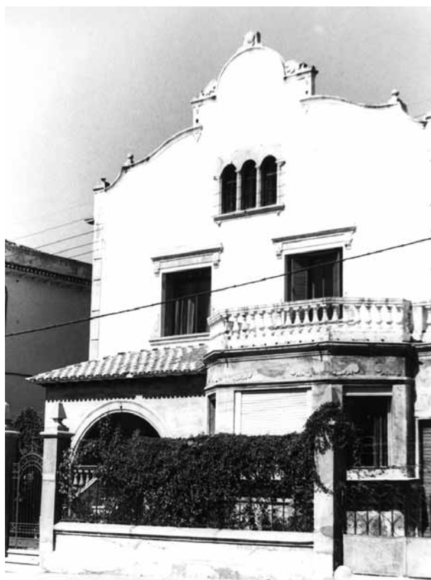
Fig. 12. Detalle del exterior de «Villa Guadalupe», en Jaraíz de la Vera. 1973. Fototeca IHH. Colección Catalogada. Sección Generalidades . Reg. 1774. Foto Goya.

De esta manera se puso fin oficialmente a la etapa granadina del instituto. Los Hoffmeyer abandonaron su finca de Huétor Vega en marzo de 1970 49 , trasladándose nuevamente ante el fracaso de las gestiones realizadas a Jaraíz de la Vera, donde el IEAA quedará ubicado definitivamente.