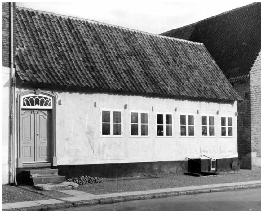
Fig. 6. Detalle de la fachada de la primera sede del IEAA (Adelgade n.º 10, Kalundborg), tomada en 1960. Fototeca IHH. Colección Catalogada. Sección Generalidades . Reg. 2170. Foto: Lefolii.

yecto. Interesados por dicho inmueble, de 300 años de antigüedad y bajo tutela del Museo Nacional de Dinamarca, los Hoffmeyer iniciaron laboriosas gestiones con el ayuntamiento de Kalundborg y el estado danés para ocupar y restaurar el edificio, emplazado en la calle Adelgade n.º 10 de la localidad (Fig. 6).