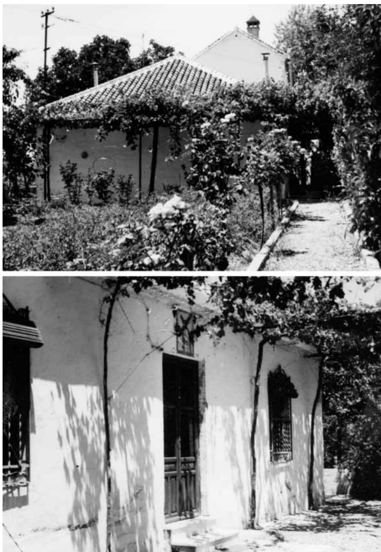
Fig. 10. La finca «Santa Elena», sede del IEAA en Huétor Vega (Granada), en 1966. Detalle parcial de la finca (Superior) y la entrada de la casa en la que se ubicó el centro (Inferior).