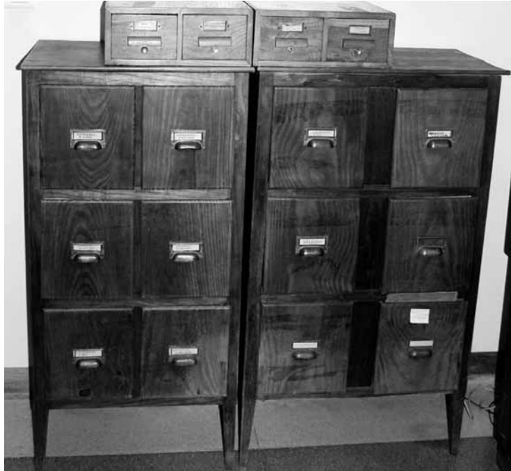
Fig. 17. Detalle de los muebles originales donde se conservan la colección de clichés (inferior), y los ficheros de información sobre las imágenes (superior). Fototeca IHH. Colección Documental. Foto: García Vuelta.

El estudio, catalogación y digitalización de las colecciones fotográficas del IEAA constituye una de las principales líneas de trabajo que se desarrollan actualmente en el IHH 71 . El trabajo sobre estos archivos culminará con la creación de una Fototeca Digital en el centro, apoyada en colecciones de imágenes de alta resolución y en un sistema de información que hará posible el acceso a sus contenidos a través de Internet. Está previsto que dicho sistema sea accesible a medio plazo través del web institucional del IHH 72 .