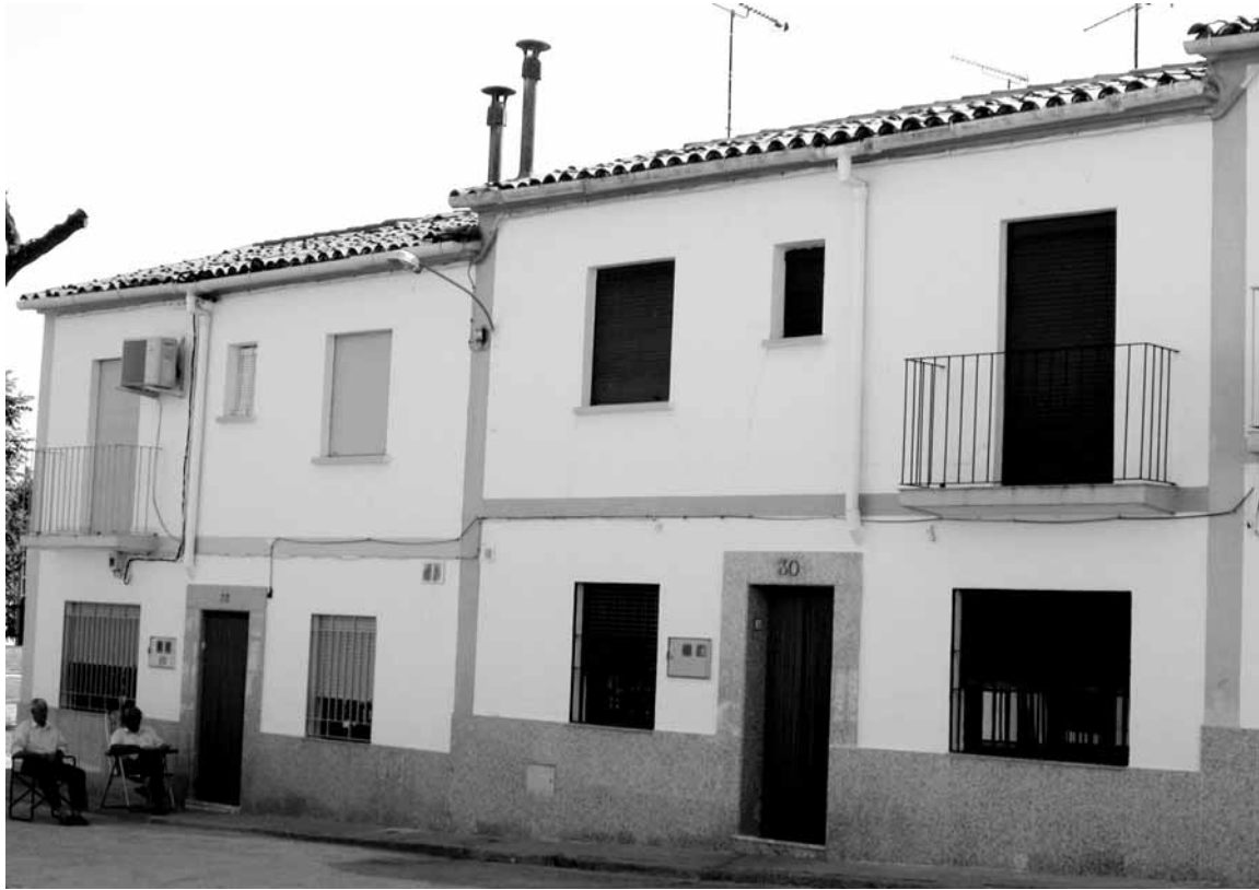
Fig. 9. Imagen actual de las casas de la calle Obispo Manzano 30 y 32, sede del IEAA durante su primera etapa en Jarafíz de la Vera. Mayo de 2006.

Institucionalmente se produce además en esta etapa un hecho de gran importancia para la proyección del IEAA, su vinculación al CSIC a través de su patronato «Menéndez Pelayo», que fue aceptada a finales de diciembre de 1964 y hecha efectiva en 1965 (IEAA, 1973: 120; Colaborador, 1975: 10). A partir de este momento, y aunque continuó siendo «un centro autónomo», el IEAA experimentó un progresivo aumento de su actividad institucional y sus fondos (especialmente de su biblioteca); gracias a su vinculación al CSIC el centro logró también la obtención de certificados como editorial (Ver Gladius IV), y su afiliación a la UNESCO 32 .