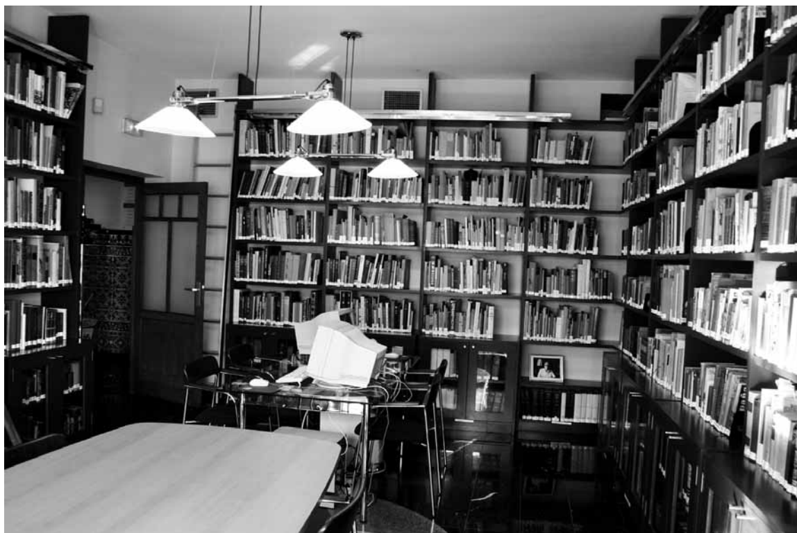
Fig. 15. La biblioteca del Instituto Histórico Hoffmeyer en la actualidad.

han visto además enriquecidas a lo largo de esta etapa con la aparición en 2002 de Anejos de Gladius , serie que continúa la colección de monografías editadas desde el IEAA (Bruhn, 1972 y 1982; Nicolle, 1976, o Martínez del Peral, 1980) y que ha hecho posible la publicación de varios títulos de especial interés para la investigación (García-Bellido, 2006 y 2004; García Jiménez, 2006; Sáez, 2005; Gabaldón, 2004; Morillo, 2002).